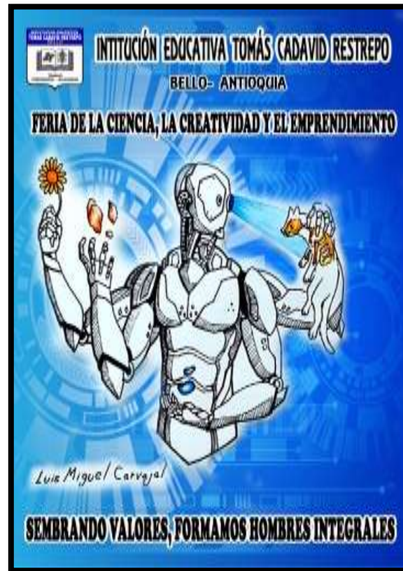
Imagen: Pendón alusivo a la feria de la ciencia 2019